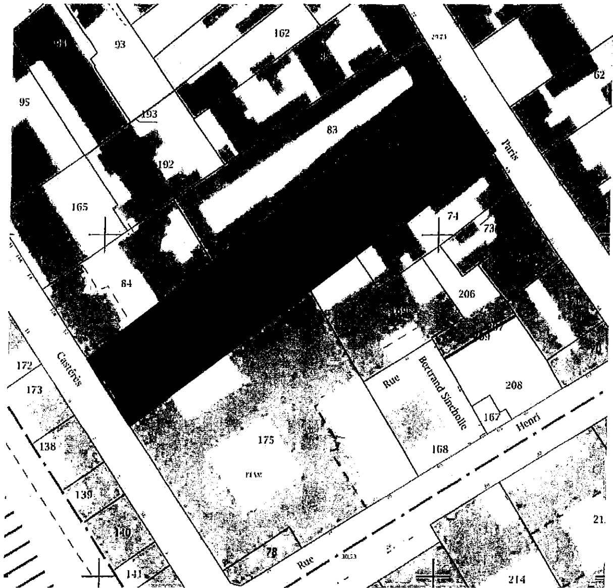
Plan des parcelles Q80, Q81 et Q82 T334 à céder

Accusé de réception en préfecture 092-219200243-20170928-DSGLC17_04291- DE Date de télétransmission : 10/10/2017 Date de réception préfecture : 10/10/2017